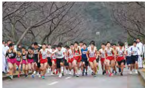
▲勢いよくスタートする参加者