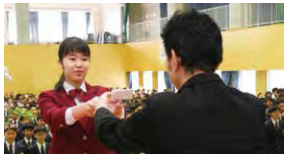
▲記念品を贈呈する卒業生

日の出小学校では、54人が卒業。卒業証書授与式に続き全校生徒が参加する「お別れセレモニー」が開催され、在校生から卒業生に向けての呼び掛けが行われ、校歌や「ふるさと」などを合唱しました。