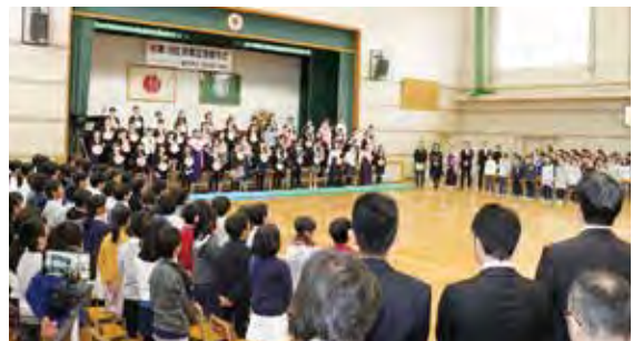
▲在校生・保護者・来賓と共に歌を歌う卒業生