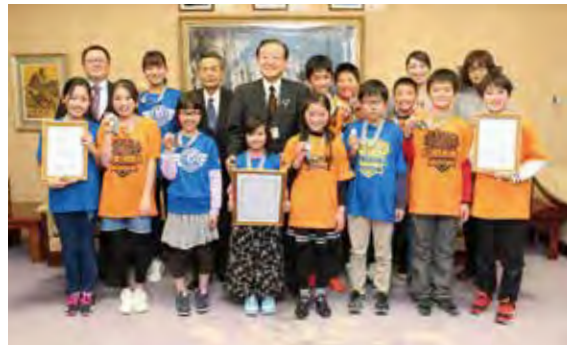
▲春日宝町TCジュニアの皆さんと市長、教育長

子どもたちは「綱引きが好きなので、ずっと続けたい。目標は全国大会出場」とはじける笑顔で話しました。