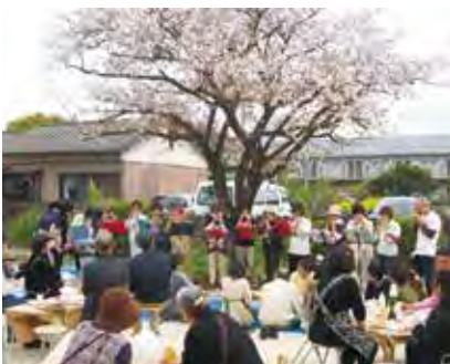
▲会員相互の交流会「さくら祭」

また、活動を応援してくれる賛助会員を募集しています。少しでも興味があれば、ぶどうの庭をのぞいてみませんか。多くの皆さんの参加を待っています。