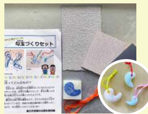
勾玉作り(体験コーナー)

放課後は自由時間！宿題をしたり、勾玉を作ったり、平日の体験スペースは小学生の憩いの場になっています。