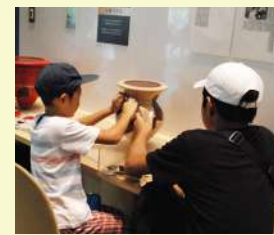
土器パズル(体験コーナー)