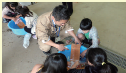
▲むかしの道具体験