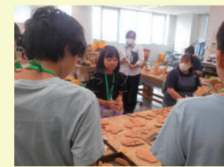
ジュニアガイド養成講座

資料館では、年間を通して様々な体験イベント・展覧会を開催している他、開館中いつでも楽しめる体験コーナーや、読書スペースがあります。