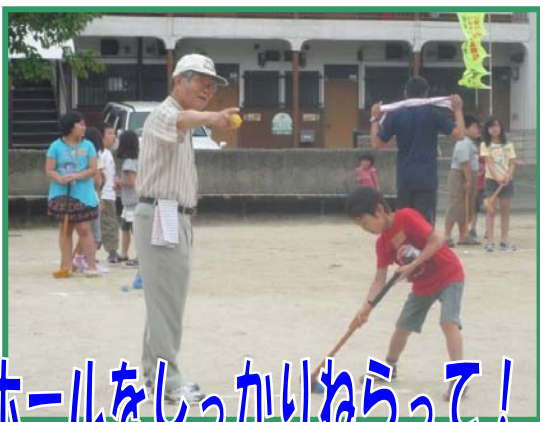
ホールをしっかりとねらって!