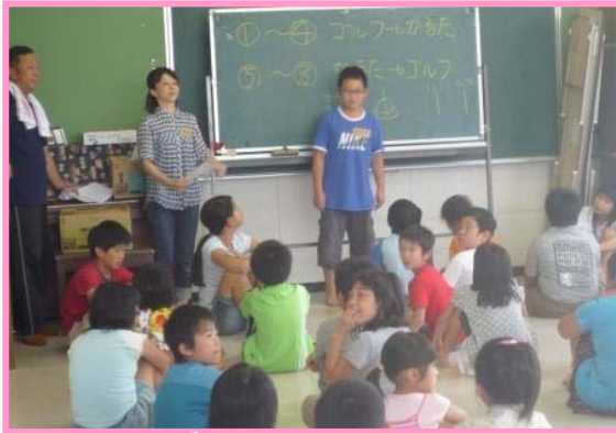
まずはホールで 子ども会代表のあいさつ