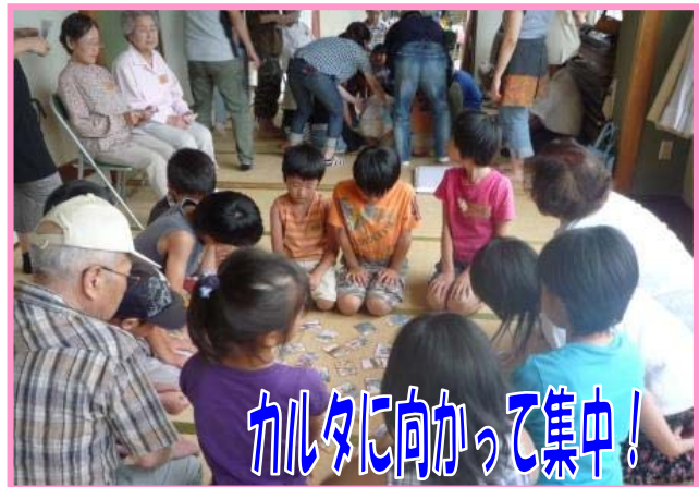
カルタに向かって集中!