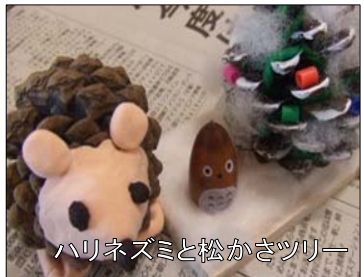
ハリネズミと松かさツリー