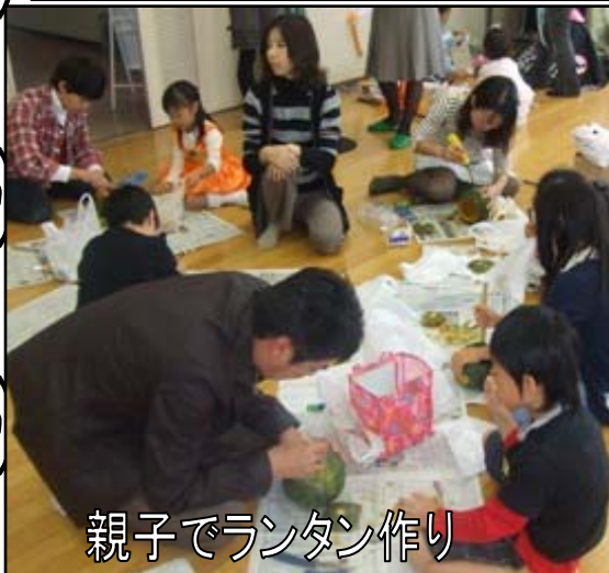
親子でランタン作り