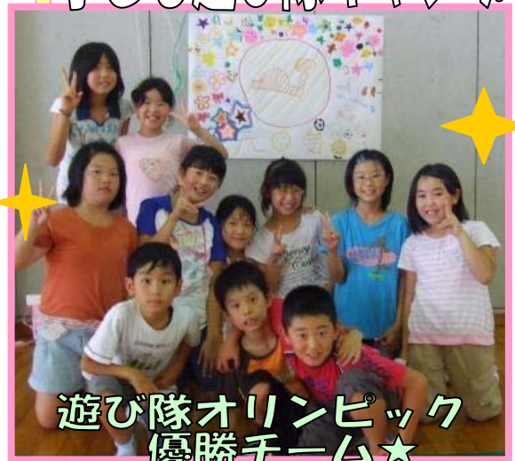
遊び隊オリンピック 優勝チーム★