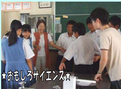
★おもしろサイエンス★

春日南中学校では、第4土曜日の午前中に地域の方々と中学生の共学の授業「なんちゅうカレッジ」が開催されています。