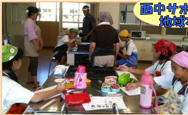
西中サポート 地域本部

春日西中学校では、生徒と地域のみなさんが共に学ぶ環境が、様々な形で整えられています。毎週木曜日に行われている「よのなか科」では、様々な分野の専門家や地域の方が参加して、身近な視点から世の中の仕組みについて共に考えていく授業を行っています。 9月11日には、「よのなか科」の一環として年に一度行われる『星雲フォーラム』が開催され、全国で活躍する著名人のグループ「エンジン01」の講師陣による出前授業のほか、『星雲タイム』として、大人参加型の50講座が行われました。 また、毎月2回、土曜日の午前中には、大学生や地域の人材のサポートで自主学習の支援を行う『土曜星雲塾』が行われています。 よのなか科の授業には、保護者や地域の方の他、ホームページで見つけたという大学生なども参加しています。興味がある方はどなたでも参加できるそうです。中学生と一緒に授業に参加してみませんか？