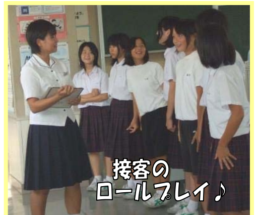
接客の ロールプレイ♪

この日学んだことは、ビジネスだけではなく、普段の生活の中でもすぐに生かしていけそうです。