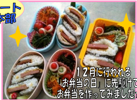
12月に行われる 「お弁当の日」に先駆けて お弁当を作ってみました☆