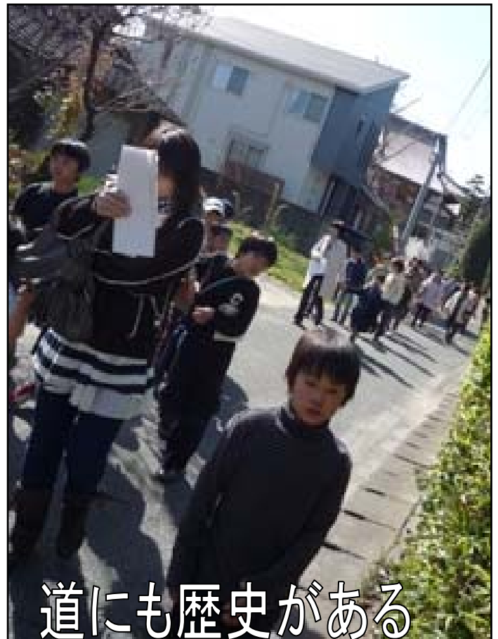
道にも歴史がある