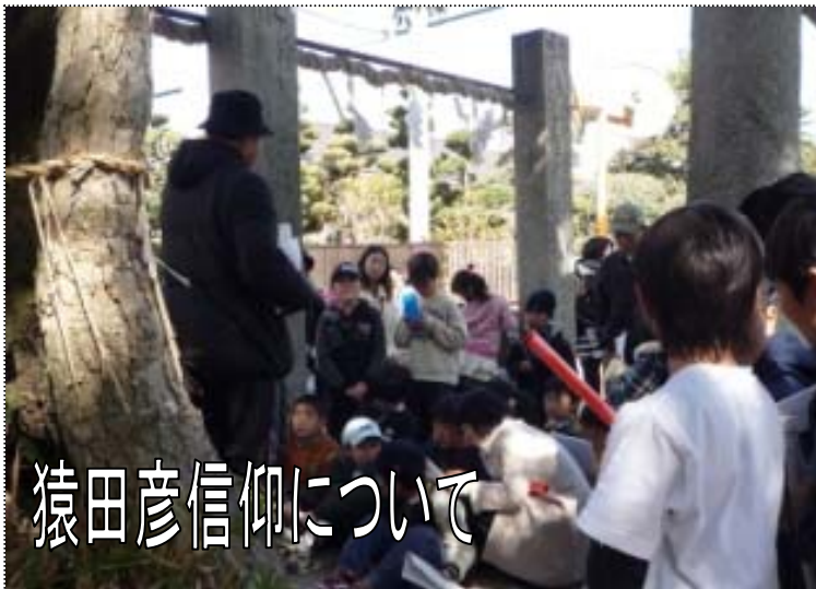
猿田彦信仰について