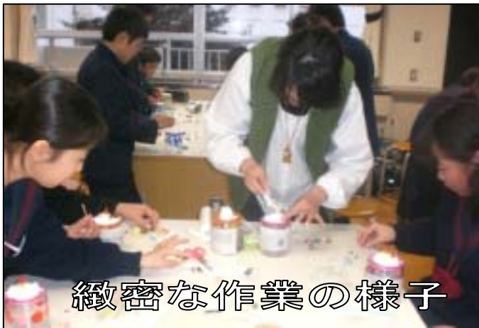
緻密な作業の様子