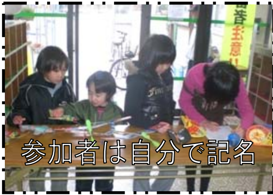
参加者は自分で記名