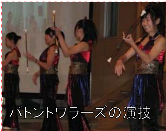
バトントワーズの演技