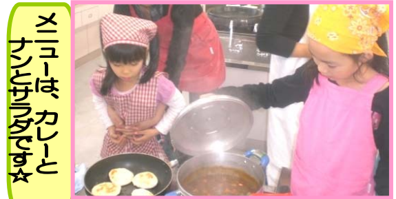
メニューは、カレーとナンとオムライス☆

春日南小学校区アンビシャス広場の「チャレンジクラブ」は、毎週木曜日の3時～5時と第2日曜日に学校施設を開放して、8つの体験活動を行っています。