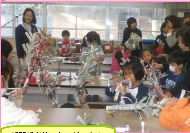
新聞紙を使ったマジック☆