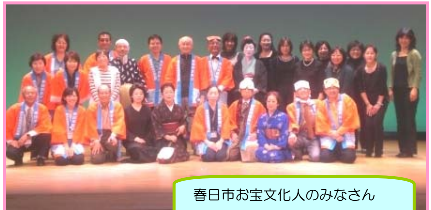
春日市お宝文化人のみなさん

学校や地域の活動で、お宝文化人さんに来てほしい!というところがありましたら、社会教育課までご相談ください。