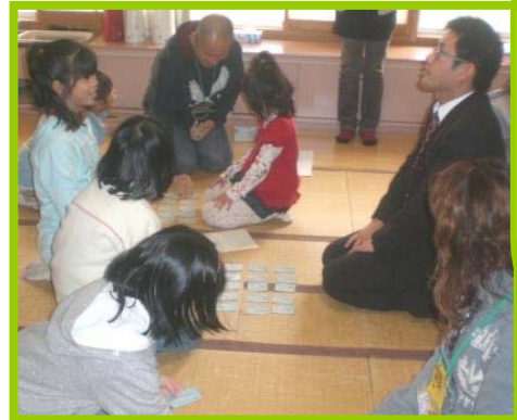
百人一首で先生と勝負！

この「チャレンジクラブ」は、PTAが中心となって運営されていて、保護者と学校と地域が一体となって「アンビシャス広場」を楽しみながら支えている。その中でたくさんのお子どもたちが育っている。いつもそんな雰囲気が伝わってくる広場です。