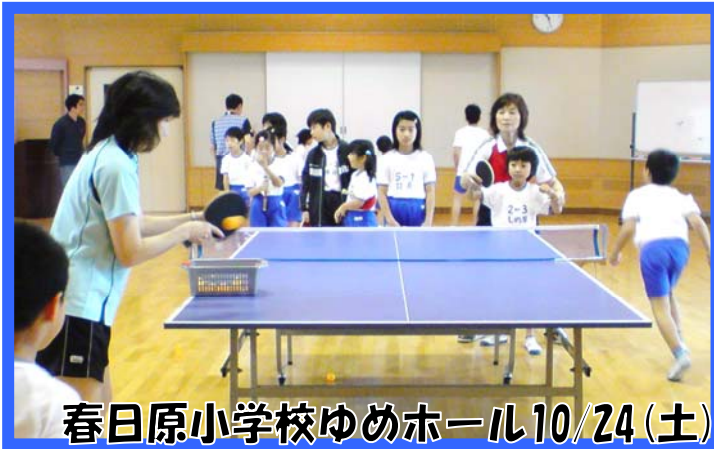
春日原小学校ゆめホール10/24(土)

春日原アンビシャス広場では、月に1回土曜日に卓球教室が行われています。体育協会と地域のボランティアの方々の指導で、約50人の児童が、2月のグループ対抗試合に向けて本格的な練習を行っています。