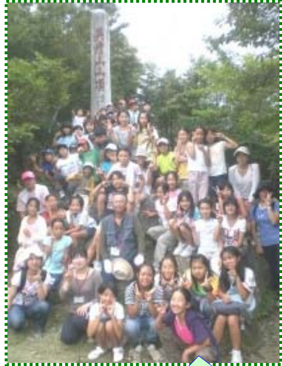
英彦山の頂上で ハイ！ポーズ☆