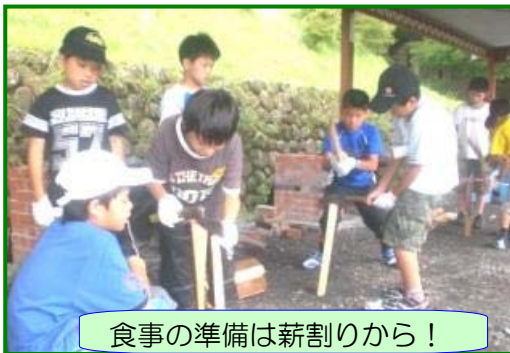
食事の準備は薪割りから！