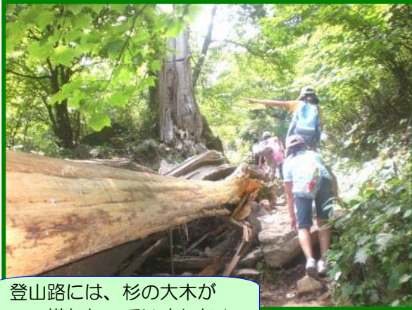
登山路には、杉の大木が横たわっていました☆