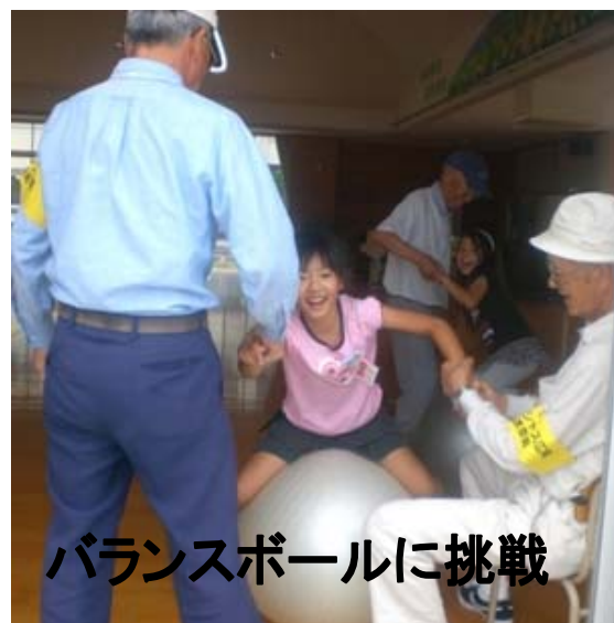
バランスボールに挑戦