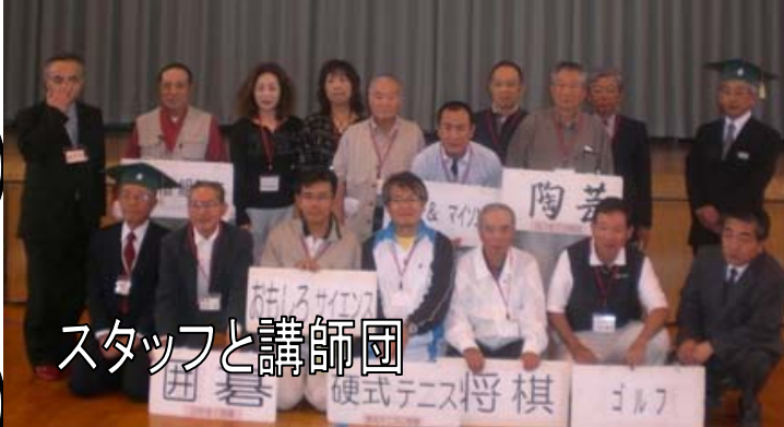
スタッフと講師団