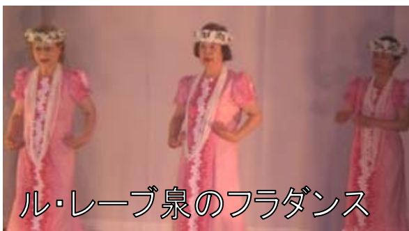
ル・レーブ泉のフラダンス

6月14日(日)にサークル活動の発表と懇親を兼ねた文化フェスティバルが盛大に開催されました。下白水南、泉公民館から和同流空手道とフラダンスの友情出演もあり、終日、集会場は満席の状況でした。