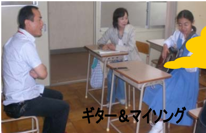
ギター&マイソング