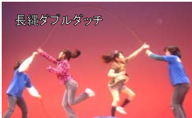
長縄ダブルダッチ

2月8日(日)に春日市アンビシャス広場等活動発表会がふれあい文化センターのサンホールで行われました。