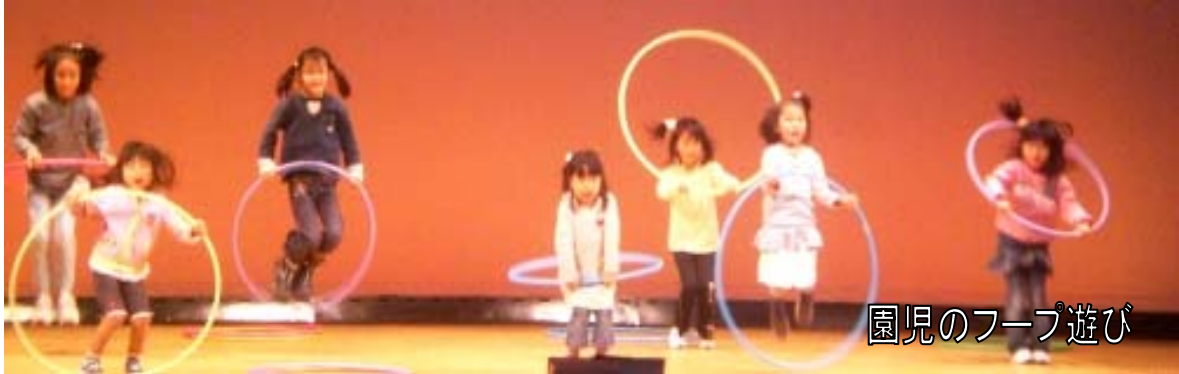
園児のフープ遊び