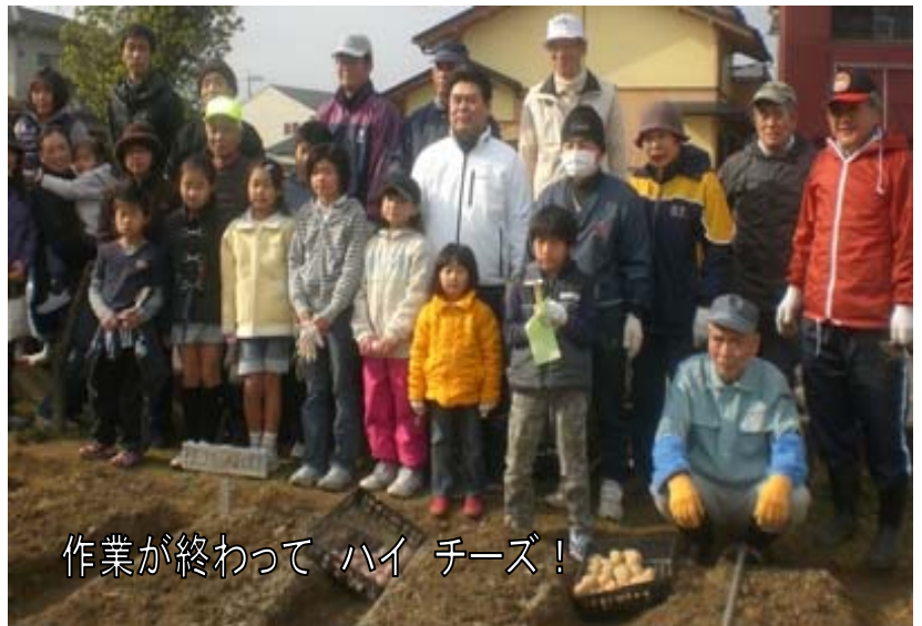
作業が終わって ハイチーズ！

2月7日(土)、下白水北ふれあい農園で子どもたちがじゃがいもの植え付けを体験しました。事前に耕作された9畝に「男爵、メイク、アンデス」の3種をボランティアの方の指導で次々と植えていきました。5月の収穫日が楽しみです。