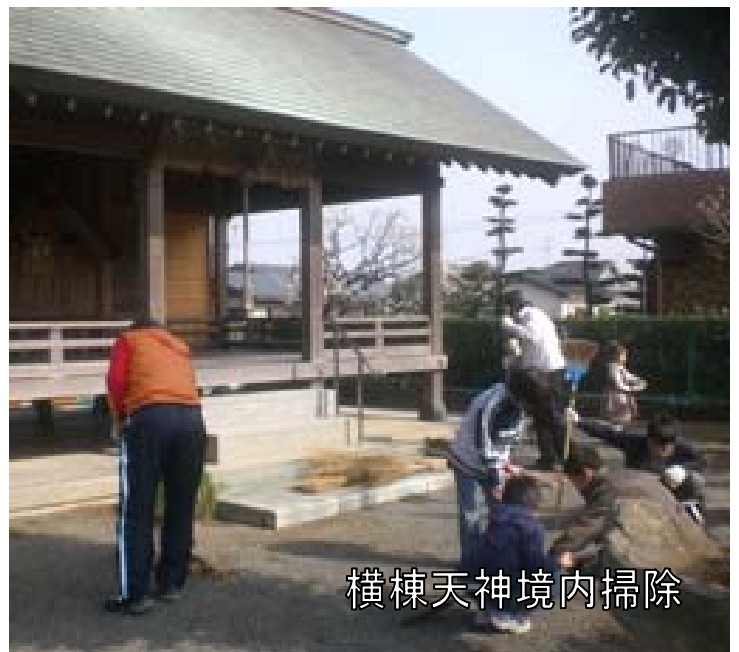
横棟天神境内掃除