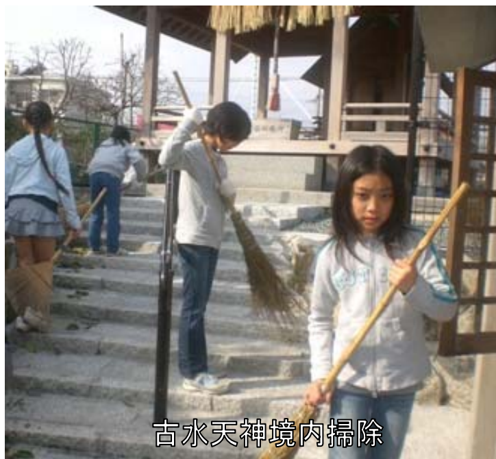
古水天神境内掃除