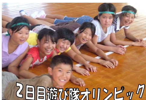
2日目遊び隊オリンピック