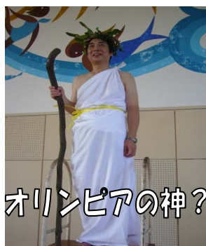
オリンピックの神?