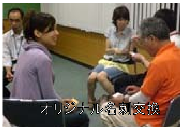
オリジナル名刺交換