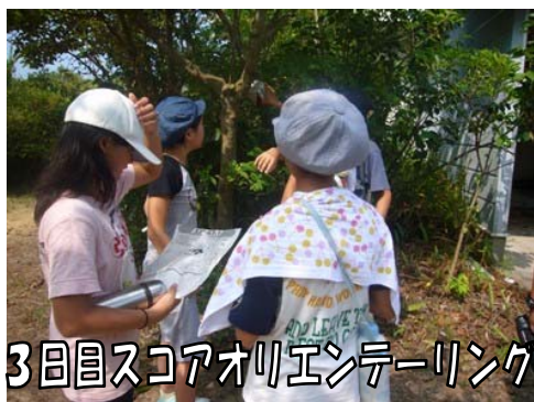
3日目スコアオリエンテーリング