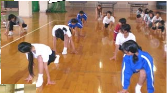
ヒップホップダンス