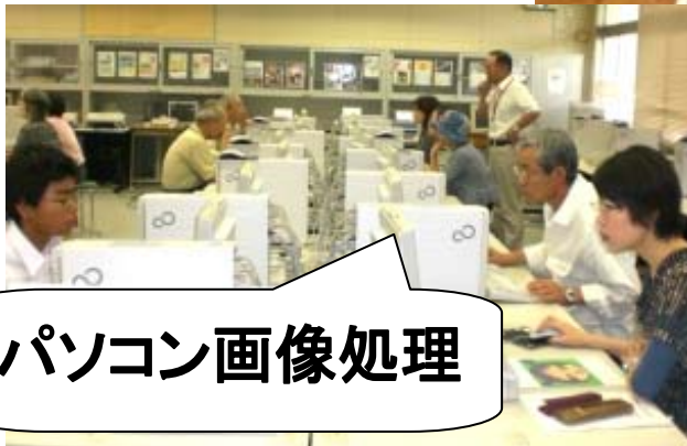
パソコン画像処理