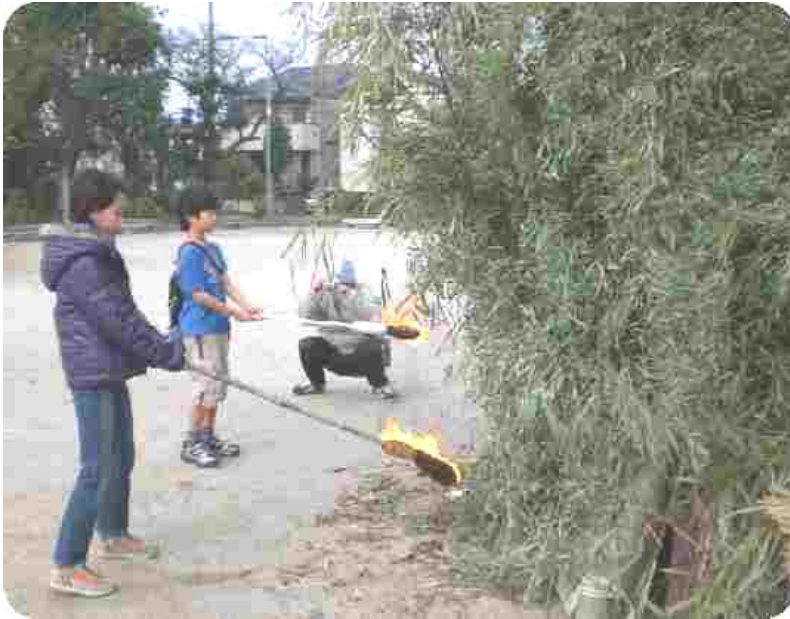
高く組まれた櫓に点火します!!