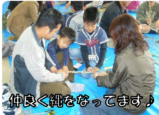
仲良く縄をなってます♪