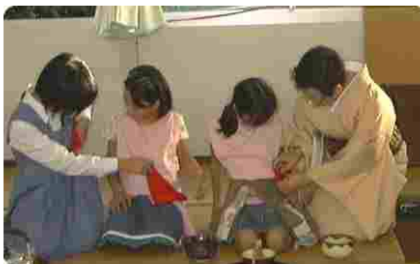
先生と中学生のお姉さんが、 ふくささばき 袱紗捌きを教えています。

この日の見学会に参加していたみなさんに、子どもたちが入れたお茶が振舞われました。みなさん、美味しそうにいただいていたようです。