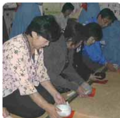
見学の方々も、お手前を拝見。