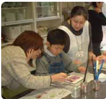
コート剤を何度も塗って 乾かします。