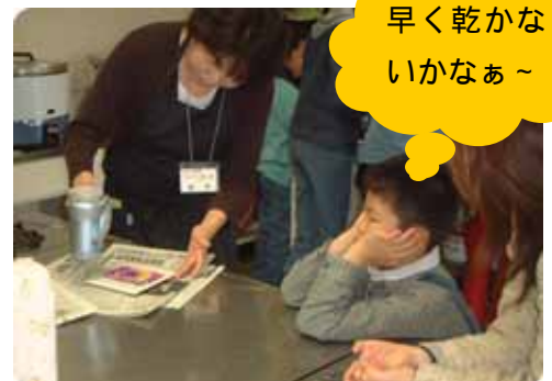
早く乾かな いかなあ～