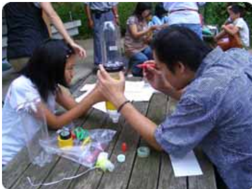
親子協同でのペットボトルロケット作り。