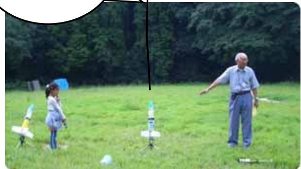
さあ、いよいよロケット発射の秒読みだ。 5・4・3・2・1・GO！