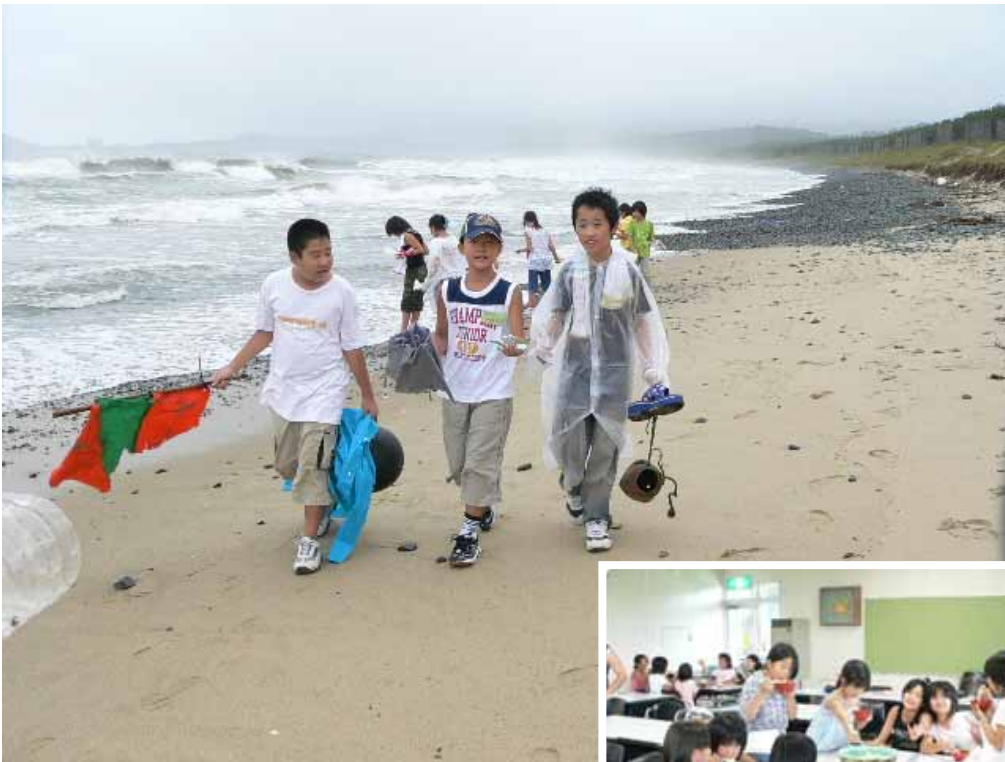
浜辺を散策し変わったものをたくさん拾いました

なんと今年は二日目に台風が直撃！当初の予定がほとんど変更になってしまいました。それでも、子どもたちはドッジビーやキャンドルの集いなどの室内で行われる活動を楽しんでいました。また、台風通過後に行われた海岸散策では、海外からの漂流物やパイナップルといったような、普段の浜辺では見られないような物が打ち上げられているのを見つけて、みんな大はしゃぎでした！