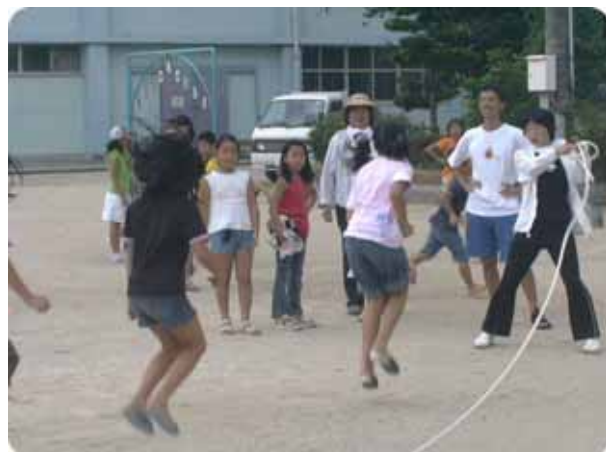
大縄跳びもなかなか上手でした