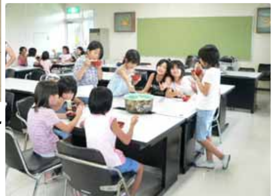
自分達で作ったそうめんは大好評！

* 『らいん』は、体験活動ボランティア活動支援センターのホームページ http://www.u-zak.net/kasuga/seishonen に載せています。自由に書き込める掲示板もありますので、ご意見、ご感想など、どしどしお寄せください！