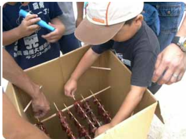
落とさないように串を並べる子ども