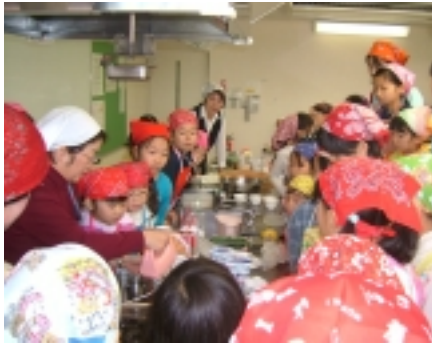
「春日のおふくろ」による デモンストレーション