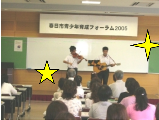
ギターとヴァイオリンの音色に参加者もうっとり

このたび、春日高校生徒会に春日市青少年育成市民会議より地域での活躍が認められ感謝状が送られました。