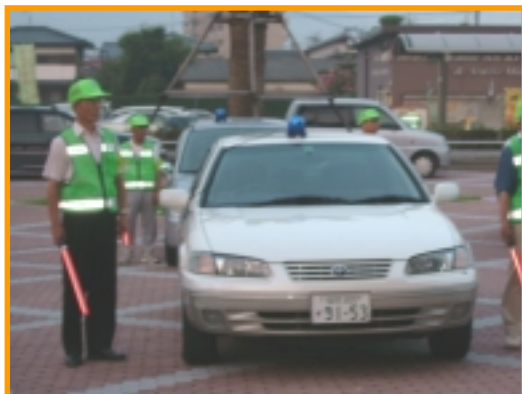
これから春日市を見回りしてくれる青パト隊。

春日市内では、少年補導員のほかに全7台の“青パト隊”の登録があります。これからは青パト隊の活躍で、より“安全安心な春日”が期待できそうです！