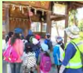
老松神社(上の宮)での様子

子どもと大人が奴国について共に学ぶ、須玖小学校ならではの取り組み、「奴国ウォークラリー」。1～6年生の異学年グループで地域の歴史を学びます。地図をたよりに、熊野神社、老松神社、赤井手古墳など7つのチェックポイントを回り、6年生が事前に資料で調べたり、地域の方にインタビューしたことを、クイズを交えて下級生に教えました。保護者、地域住民など約100名のボランティアが引率と見守りにあたり、子どもたちとの交流を深めていました。