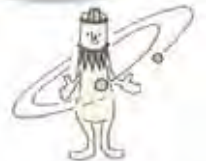
星の館 キャラクター スコープくん