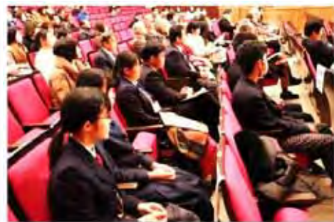
パネルディスカッションを熱心に聴く 学生のみさん