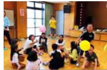
白水ヶ丘 ようこそ！子ども会体験会