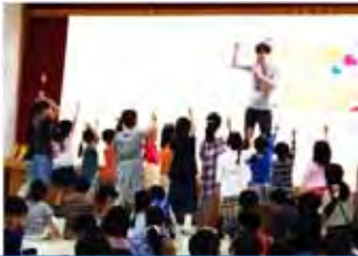
若葉台西 白熱のじゃんけん大会！