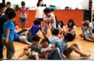
泉 大根ゲーム 力いっぱいひっぱるぞ！

今年度も子ども会活動がスタートし、市内各地で「新1年生歓迎会」が開催されました。「子ども会」とは同じ地域に住む、さまざまな年齢の子どもが集まり、子どもが主体となって活動をする組織です。今年度の新1年生歓迎会も5、6年生が中心となって企画や準備、当日の進行も行いました。少し緊張した面持ちの1年生に高学年が優しく声をかけるなど、子ども会のリーダーらしい姿が見られました。今後、子ども会活動を通し高学年のお兄さん、お姉さんを目標に1年生も大きく成長することを期待します。