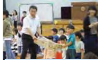
日の出・サンビオ 校長先生も大活躍！ 新聞ボール運び競争