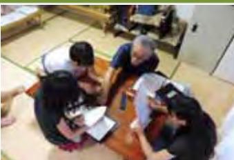
すぐっ子 自由クラブ

須玖小学校 ビーチボールバレー クッキングクラブ 須玖南公民館 将棋 オセロ他（自由クラブ）