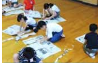
原町 新聞やぶりゲーム！ 誰が一番長くできるかな！