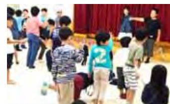
光町 陣地がだんだん小さくなるよ！新聞じゃんけん