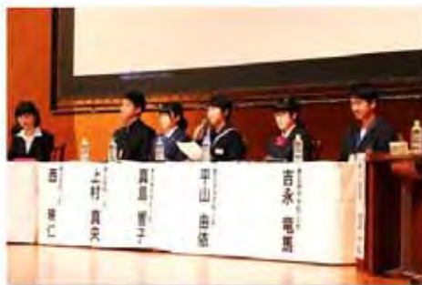
学生のみさんによる パネルディスカッション