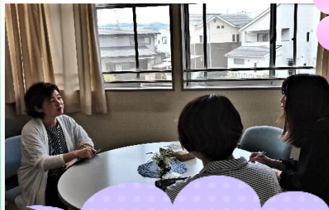
カウンセラー(公認心理士)による入級生やその保護者を対象とした、教育相談を行っています。