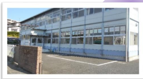
春日市教育支援センター・マイルスクールは、春日市教育委員会が設置・運営しています。