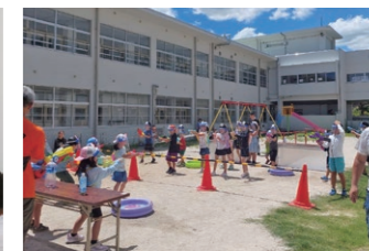
▲おやじの会（水鉄砲遊び）