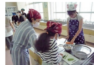
▲保護者ボランティア

保護者や地域の方が、特技を生かして学校の教育活動の支援や運営補助など、広くボランティアとして関わっています。