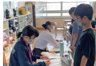
▲中学生による丸付け支援

子どもたちは、大人の支援を受けるだけでなく、自治会行事への参画や、地域清掃活動など、様々な地域貢献活動を行っています。