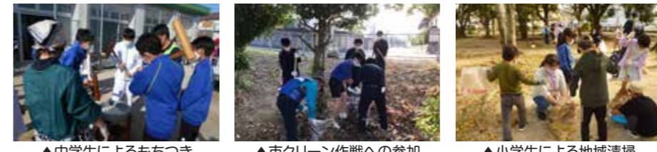
▲中学生によるもちつき ▲市クリーン作戦への参加 ▲小学生による地域清掃

子どもたちは、大人の支援を受けるだけでなく、自治会行事への参画や、地域清掃活動など、様々な地域貢献活動を行っています。