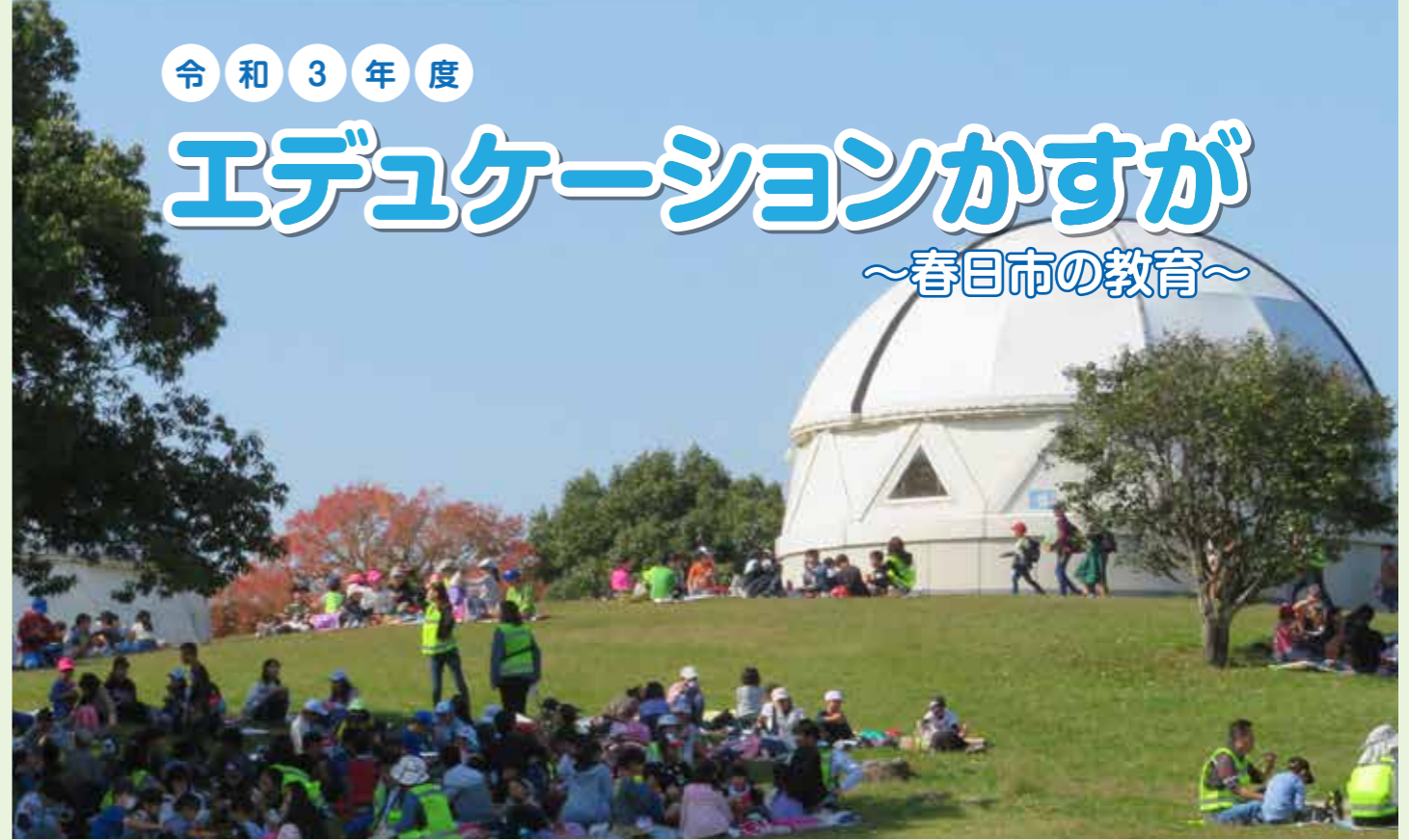
▲学校・家庭・地域・児童の四者で創る双国ウォークラリー(令和元年度 須玖小学校)