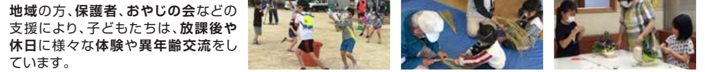
▲水鉄砲バトル ▲しめ縄づくり体験 ▲放課後子供教室(アンビジャス広場)

地域の方、保護者、おやじの会などの支援により、子どもたちは、放課後や休日に様々な体験や異年齢交流をしています。