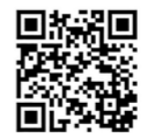
春日市ウェブサイト

福岡県春日市教育委員会 教育部教務課 TEL 092-584-1111 FAX 092-584-1153 https://www.city.kasuga.fukuoka.jp/