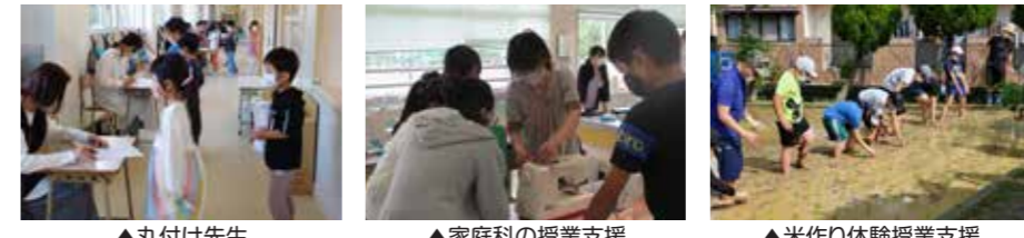
▲丸付け先生 ▲家庭科の授業支援 ▲米作り体験授業支援

保護者や地域の方が、特技を生かして学校の教育活動を支援したり、プリント学習の丸付けなど、広くボランティアとして関わっています。