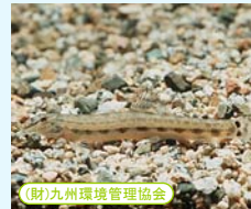
■ヤマトシマドジョウ