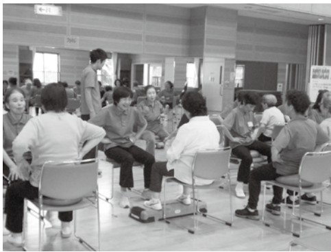
介護予防教室(転ばん塾)

※介護が必要になっても、住み慣れた地域で自分らしく人生の最後まで暮らせるよう住まい・医療・介護・予防・生活支援が一体的に提供される支援体制